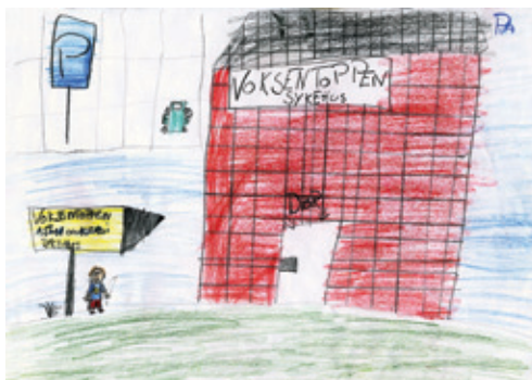
Tegning: Laget av barn med atopisk eksem, Rikshospitalet