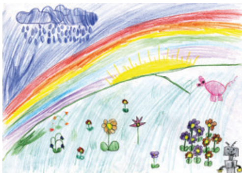
Tegning: Laget av barn med atopisk eksem, Rikshospitalet

For å få effekt bør det brukes en salve som inneholder mer enn 3 % salisylsyre. Denne kan kjøpes på apotek.